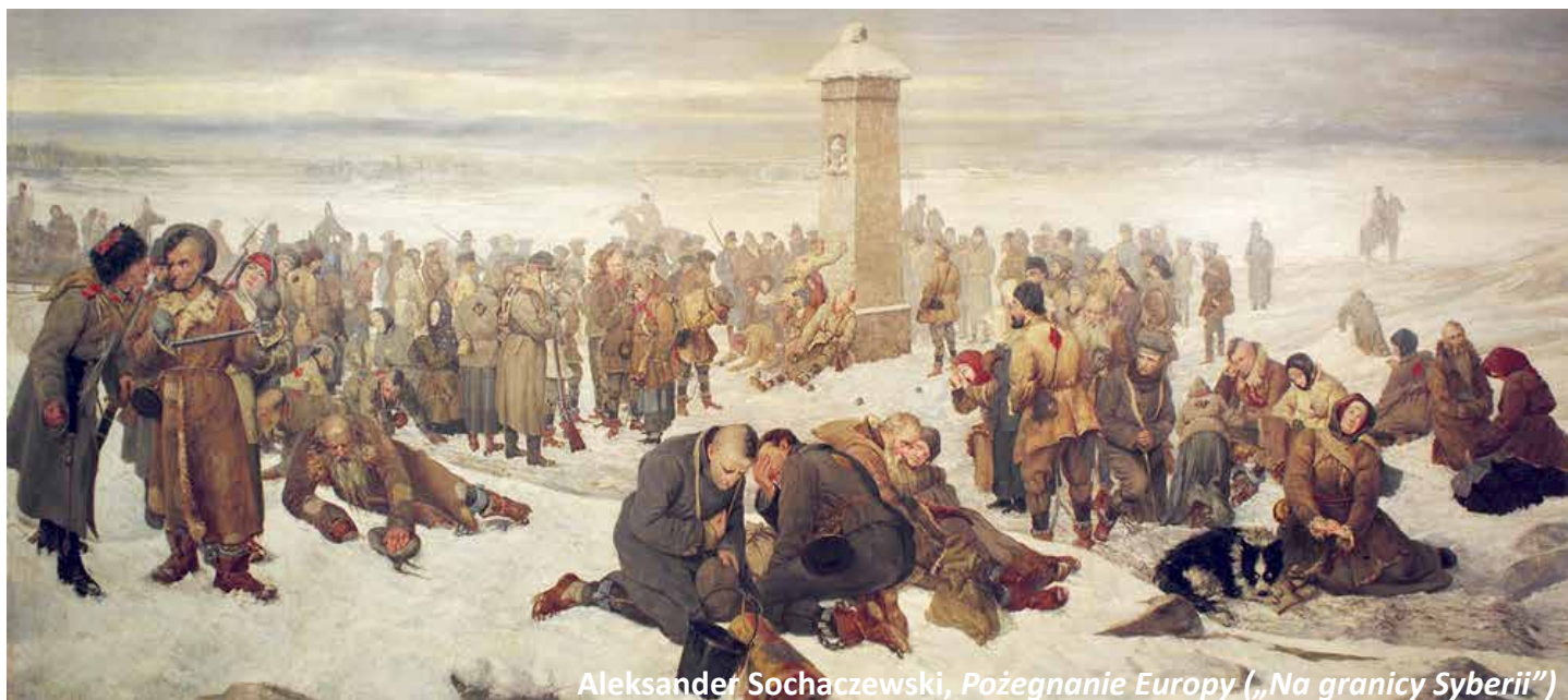
Aleksander Sochaczewski, Pożegnanie Europy („Na granicy Syberii”)

„Znad Rudawy” - Miesięcznik Społeczno-Kulturalny Gminy Zabierzów. ISSN 1505 2869. Nakład 2500 egz.