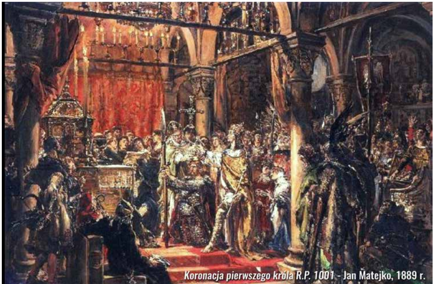
Koronacja pierwszego króla R.P. 1001 - Jan Matejko, 1889 r.