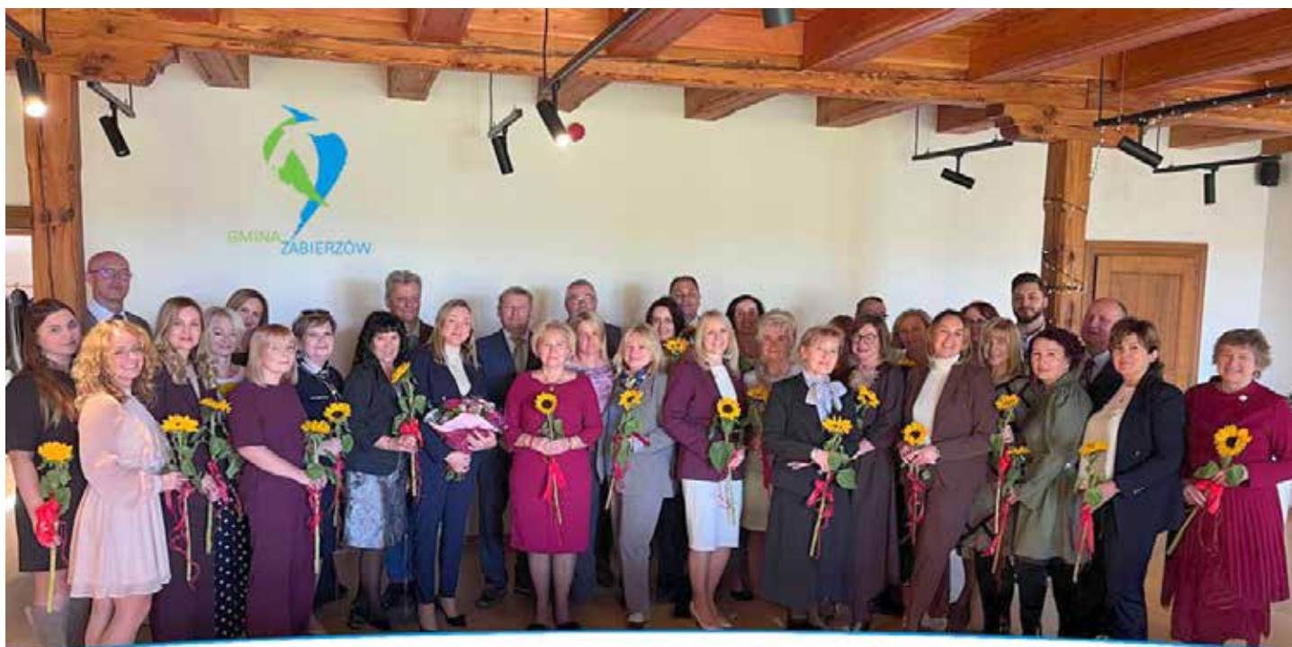
Gminne obchody Dnia Edukacji Narodowej

Podczas uroczystości wręczono nagrody i wyróżnienia dla dyrektorów i nauczycieli, którzy w minionym roku szkolnym szczególnie zasłużyli się dla rozwoju edukacji w gminie Zabierzów. Nagrody te stanowią wyraz uznania za profesjonalizm, kreatywność oraz nieustanną troskę o najwyższą jakość nauczania. Spotkanie w Kochanowie było również okazją do rozmów, wymiany doświadczeń i wspólnego świętowania w przyjaznej atmosferze. Uroczystość jeszcze raz przypomniła, jak ważna i wymagająca, a zarazem piękna, jest praca nauczyciela — zawód, który kształtuje przyszłość całej społeczności.